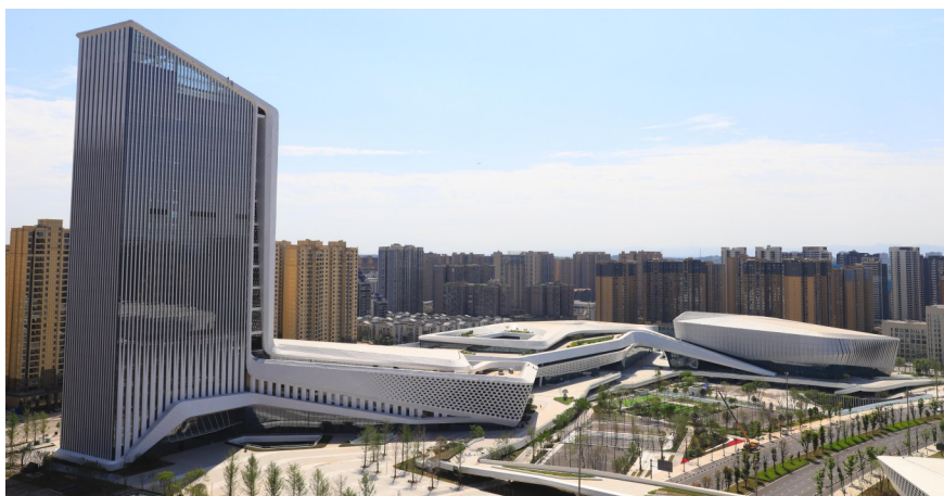
简阳市文化体育中心。

5月底,柔道项目测试赛率先在简阳市文化体育中心拉开帷幕,通过全员参与、全要素、全流程演练,全面磨合赛事指挥运行体系流程。