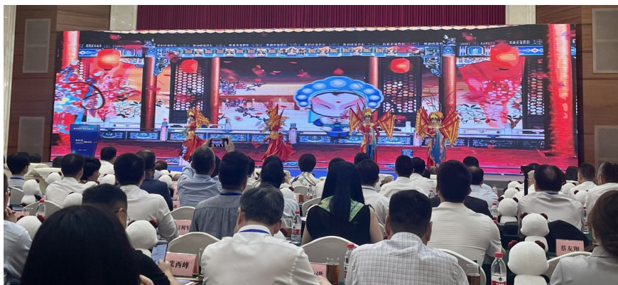
6月6日,四川文化产业投资推介会暨项目签署仪式在深圳举行。

去年,四川相继出台《四川省引导扶持文化企业发展六条措施》《四川省重大文艺项目扶持和精品奖励办法(试行)》