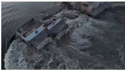
6月6日在乌克兰赫尔松州拍摄的被炸毁的卡霍夫卡水电站大坝(视频截图)。