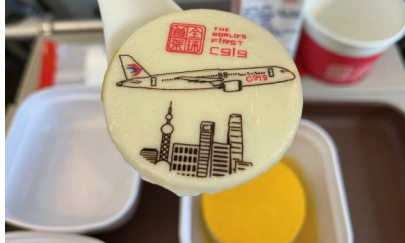
② 具有纪念意义的特制布丁。