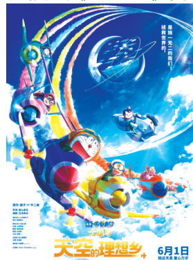
《哆啦A梦：大雄与天空的理想乡》海报