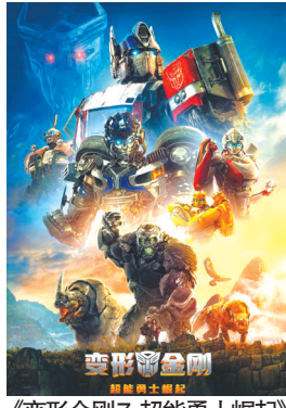
《变形金刚7：超能勇士崛起》海报