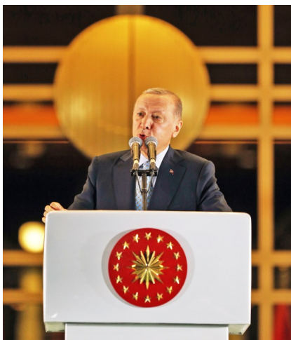
5月29日凌晨，土耳其总统埃尔多安在安卡拉发表讲话。

危机，本币里拉对美元汇率暴跌。按照法新社的说法，尽管土耳其政府采取大规模干预举措，仍无法改变里拉下跌颓势。