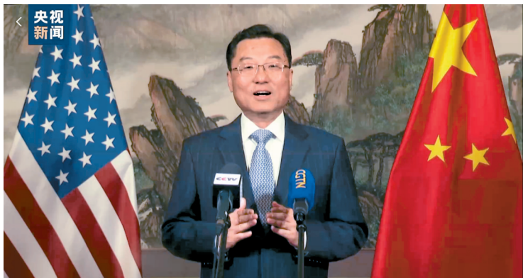
中国新任驻美国大使谢锋