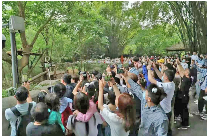
成都熊猫基地的大熊猫吸引大量游客参观。