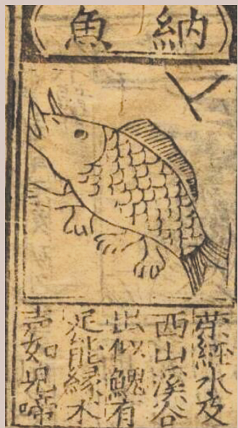
多种古籍记载“鮡鱼”产自雅安。

显然古人反对捕食这种鱼类，主要还是受儒家仁爱思想的影响，认为食用这种鱼是很不君子的。到了清代，这种呼声更为普遍。比如郑光祖《一斑录》：“娃娃鱼，又名孩儿鱼。偶有大至百斤者，无鳞，首略似鲤，尾略似鲇，有手足，似人，指缝联皮如鸭脚，能鸣声，似儿啼，能上岸上树。渔者网得为不祥，入滚水去其皮，治而烹之。鸣甚哀，见之惨然。”沈大成《孩儿鱼》：“鱼身而人形，缘木捕之急；最怜风雨生，呱呱林中泣。”如果说上述两则史料还是委婉倡导，而下引朱锡绶的《人鱼》则是正面直呼：“溪中有鱼，四足，