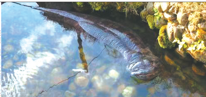
娃娃鱼浮出水面呼吸。

雅雨、雅女、雅鱼，这“三雅”被公认是雅安最具影响力的名片。现在人们所说的“雅鱼”一般是指齐口裂腹鱼和重口裂腹鱼，又名丙穴鱼、嘉鱼、丙穴嘉鱼，统称裂腹鱼。