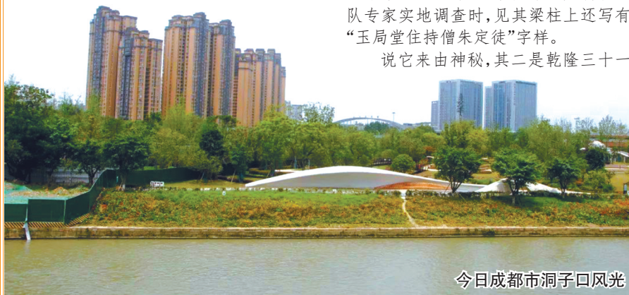
今日成都市洞子口风光