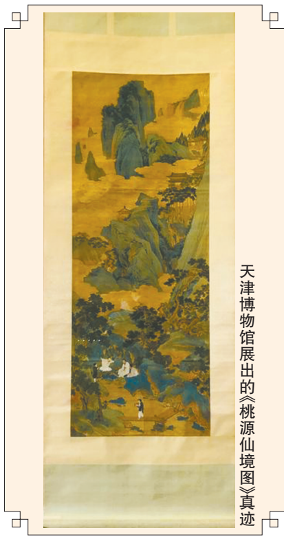
天津博物馆展出的《桃源仙境图》真迹

生活服务广告 广告热线 86969860 86969966 独家代理：四川欣闻报刊发行有限责任公司 收费标准：70元/行/天，每行13个字 代办点 锦江区 84545086 金牛区 83171377 红塔路 86925677 眉山市 3811121 岷 峨 88748235 简阳市 18030870828 阆 中 15681062088 雅安传承 15281268866 寻找全省 业务代理