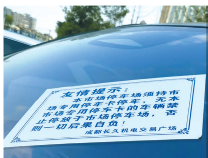
挡风玻璃被贴上“友情提示”。

表示，他在这里经营灯具3年，但没有办理停车卡，“不划算，一年费用1800元，还不如停在附近小区里。”对于市场内部必须持有停车卡才能停车的规定，多位商家予以证实，他们均表示，办理停车卡看个人意愿，有些办了卡的，就可以把车辆停在车位上，“夜间停车的价格好像还