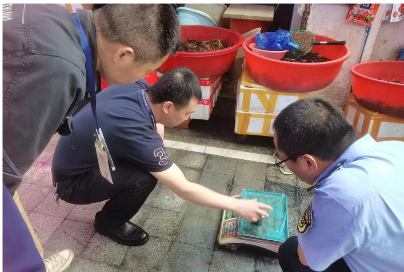
消费者质疑成都青石桥市场商家缺斤少两，锦江区市场监管局执法人员突击抽查。

“五一旅游投诉专区”开启以来，收到网友的反馈、投诉上百条，其中，一半以上与价格相关。记者也在接到线索后第一时间跟进核实，追踪到底。成都兔头“涨声一片”，前一天还