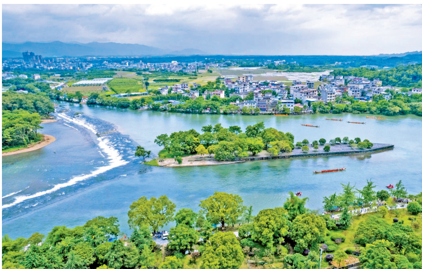
俯瞰秀美灵渠。

在今广西桂林兴安县城东部的分水塘村,灵渠渠首工程位于此处。作为整个工程壅水分流的核心枢纽,湘水(指湘江上游的海洋河)在这里三七分开,“于湘流砂碛中垒石作铍嘴,锐其前,逆分湘流为两”,铍嘴将湘水一分为二,再经大天平、小天平将江水壅高水位后,分别引入北渠、南渠。三分湘水经南渠,汇入漓江;七分湘水进入人工开凿的约10公里的北渠,绕过湘江旧道之后再次汇入主河道,而原有的湘江旧道也可以在洪水来临时起到再次泄洪的作用。