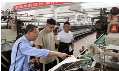
采风团在红旗丝绸公司参观采风。