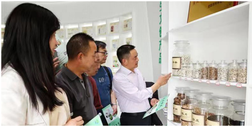
工作人员向采风团介绍僵蚕。

目前,乐至县已将僵蚕产业创建定位为“全国单项冠军产业”,力争到2025年建成现代化僵蚕基地2万亩,建成僵蚕特产品集聚发展区、全国僵蚕集散交易中心,创建“中国僵蚕之乡”。