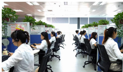
▲服务外包企业。

“现在干部群众对发展天冬产业的热情都很高涨。”康厚林用一组数据来印证这句话：短短三年时间，东兴区实现天