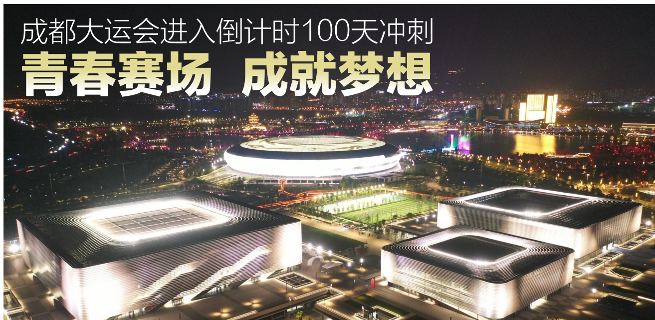
东安湖大运场馆夜景。

4月19日，“成都成就梦想”第31届世界大学生夏季运动会倒计时100天主题活动在东安湖体育公园火炬塔广场举行，这标志着成都大运会正式进入倒计时100天冲刺。活动上，成都大运会官方服饰正式亮相，大运会推广歌曲《城市的翅膀》《梦的色彩》同时发布。 100天后，成都与世界相约！100天后，成都成就梦想！