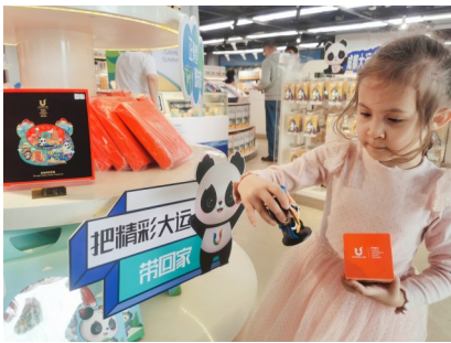
4月19日，成都大运会官方特许零售北京鸟巢旗舰店正式开业。一位外国小女孩购买了大运会“蓉宝”川剧变脸盲盒手办。