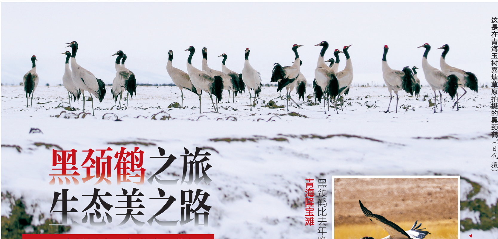
这是在青海玉树嘉塘草原拍摄的黑颈鹤。