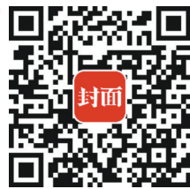
扫二维码参与寻路东坡知识挑战赛