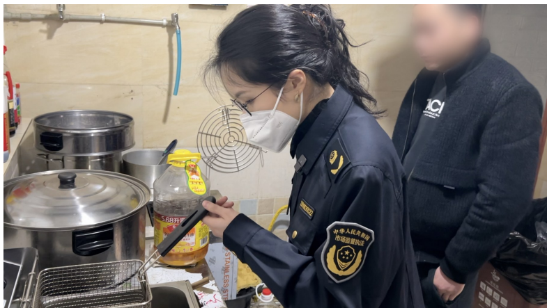
执法人员检查厨房卫生。