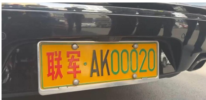
被民警挡获的假军牌车。