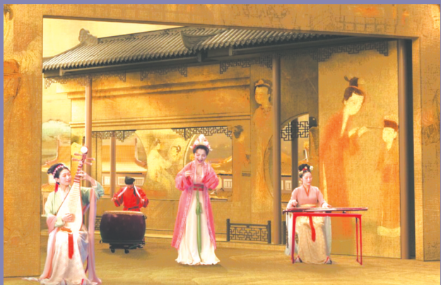
吴碧霞携手自得琴社演绎《早春奇遇》。