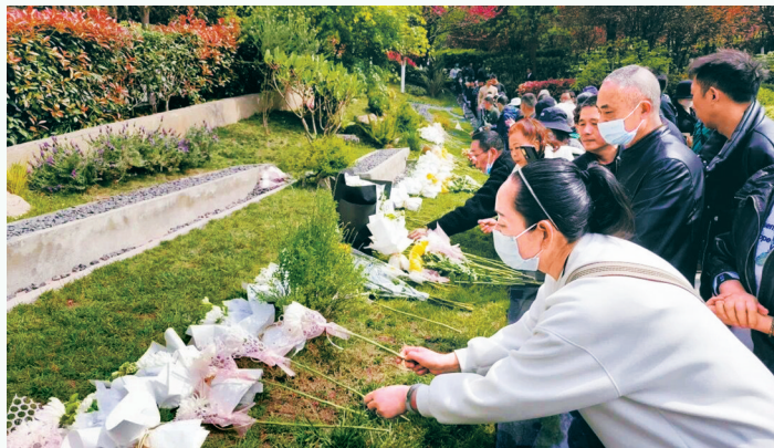
长松寺公墓生态葬,亲人为逝者献上鲜花。

成都市民政局相关负责人表示,近年来,成都市大力提倡厚养礼葬、文明节俭、生态环保的现代殡葬新风尚。为推动相关工作,成都于2017年出台惠及所有市民的基本殡葬服务项目补贴政策,明确节地生态安葬专项奖补;2021年,成都市民政局牵头市级相关部门对惠民殡葬政策进行修订完善,扩大惠民殡葬补助对象范围,提高节地生态奖补标准,进一步规范优化惠民殡葬补贴申报程序。全市公墓机构积极响应号召,在“清明节”期间,广泛开展公益安葬、集体公祭等活动,大力推广树葬、花葬、草坪葬等节地生态葬法,每年免费捐赠生态墓(格)位1500个以上。