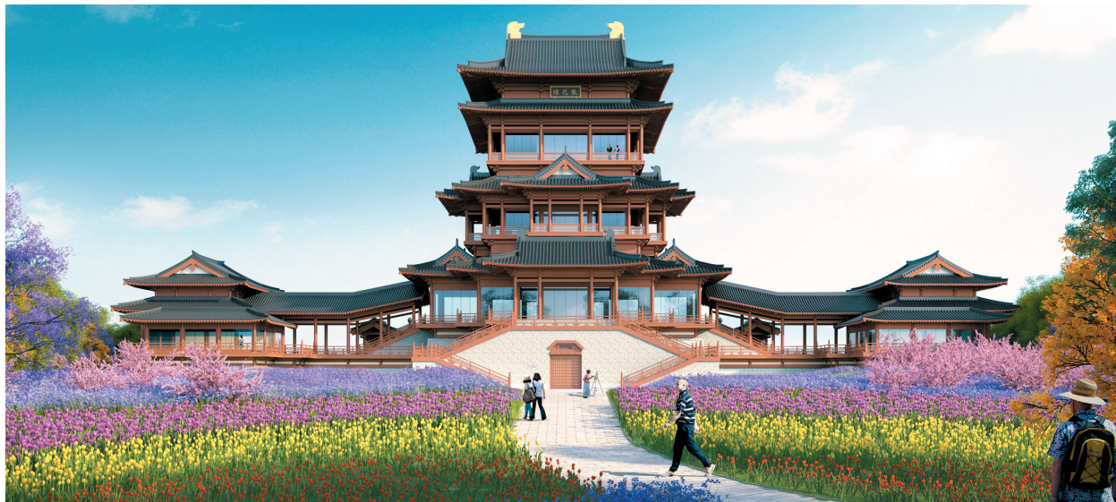
“散花楼”效果图。

3月30日，随着最后一根钢柱成功吊装焊接，由中建八局承建的2024年成都世界园艺博览会主会场园区内的最高建筑“散花楼”正式封顶，这是继首栋单体综合服务馆封顶后，世园会项目取得的又一突破性进展，标志着整个园区建设抵达了最高点。