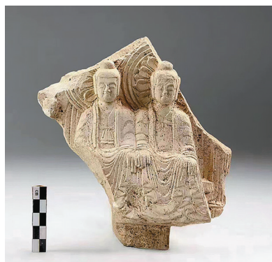
吉林琿春古城村1号寺庙址出土的佛像残片。