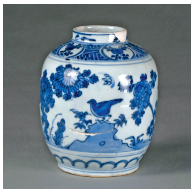
河南开封州桥及附近汴河遗址出土的明晚期景德镇窑青花花卉纹罐。