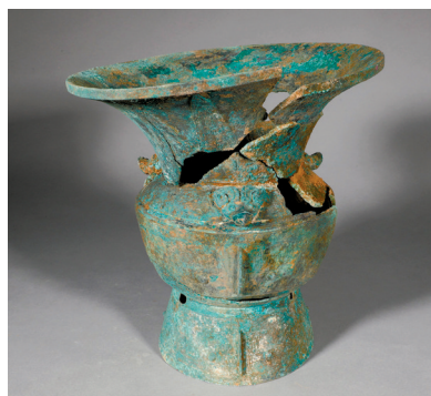
河南安阳殷墟商王陵祭祀坑K23出土的青铜器。