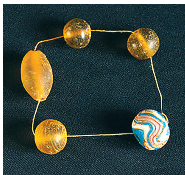
贵州贵安新区大松山墓群坟坝顶墓群出土玻璃制品。