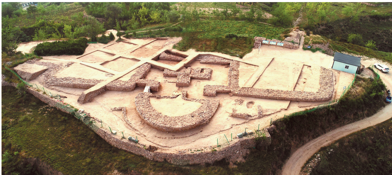
山西兴县碧村遗址发掘出土的东门址遗存(资料照片)。