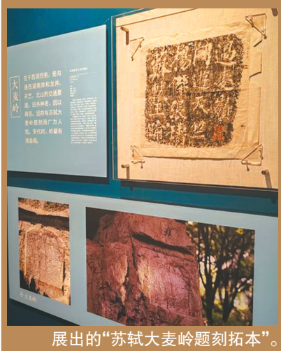
展出的“苏轼大麦岭题刻拓本”。

的工作，已经很接近今天的考古，只是没有进行考古挖掘。”魏祝挺说，像元代周伯琦的摩崖题刻《理公岩记》，是江南地区发现的体量最大的元代书法作品之一，曾经由明代文人郎瑛、叶彬重新发现过，但是后来它又湮没了，到了晚清，才被书法家钱松和胡震发现。