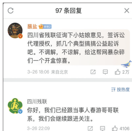
针对网民留言，四川省残联发声。