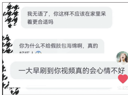
网络上针对“春游哥哥”的语言攻击。