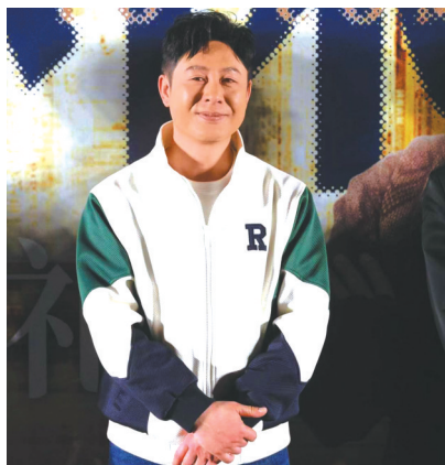
张颂文在《不止不休》北京首映礼现场。

真实质感，花费了众多时间、精力去采访那个时代的亲历者，搜集了大量现实材料，最终浓缩为一个暖心又励志的故事。面对较为沉重的社会话题，影片没有着重刻画苦难，而是以平实克制的方式呈现矛盾。通过类似纪录片的影像表现形式，为观众传递极具真实感的信息。