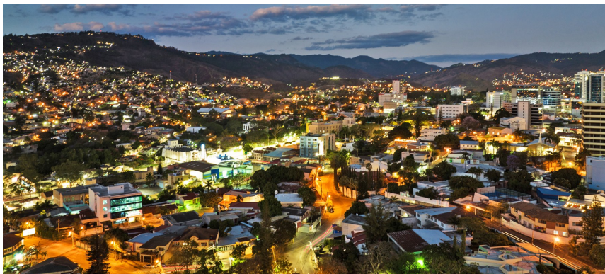
这是3月25日航拍的洪都拉斯首都特古西加尔巴。

洪都拉斯在西班牙语中意为“深邃”,这里原为印第安土著的居住地,也曾孕育了玛雅文明。洪都拉斯西北部的