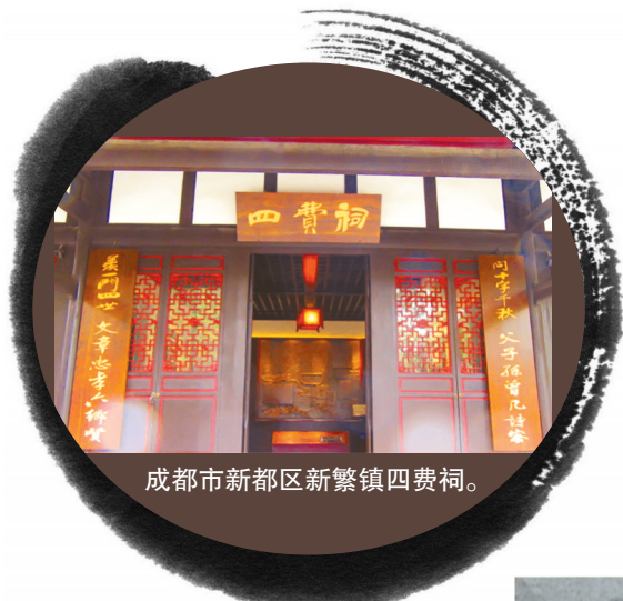
成都市新都区新繁镇四费祠。

费密(1625年-1701年),清代著名学者、诗人和思想家,字此度,号燕峰,四川新繁(今成都市新都区新繁镇)人。费密曾参加杨展组织的地主武装,抗击农民军。失败后,走避陕西,不久,又偕其父费经虞(曾任明代广西知府)卜居江苏泰州野田村。“州守知其贤,为除徭役。”当道拟举鸿博,荐修《明史》,皆为辞。费密守志穷理,讲学著述,在文学、史学、经学、医学、教育和书法等方面都有很高造诣。唐鸿学于《弘道书·跋》将费密与清代大学者顾亭林、颜习斋并称。费密晚年幽居江苏扬州30余年,授徒自给,著书终生。