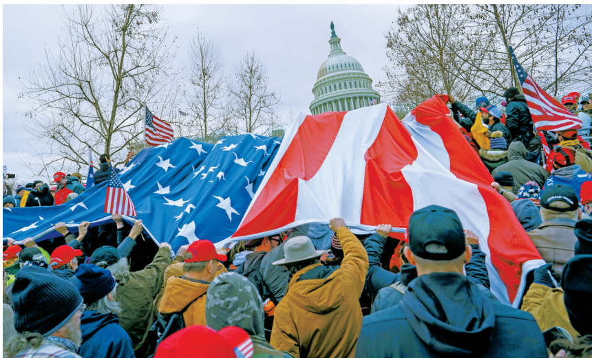
2021年1月6日，在美国首都华盛顿，时任美国总统特朗普的支持者举行示威游行。