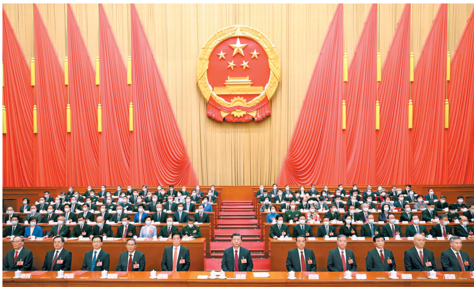
3月13日，第十四届全国人民代表大会第一次会议在北京人民大会堂闭幕。中共中央总书记、国家主席、中央军委主席习近平发表重要讲话。