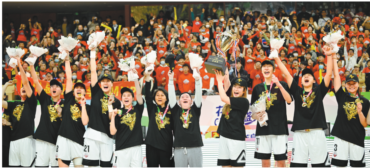
3月12日,四川远达美乐队成员在颁奖仪式上庆祝。

3月12日晚,2022-2023赛季中国女子篮球联赛(WCBA)总决赛上演巅峰对决,四川远达美乐女篮坐镇主场四川省体育馆,以83:82险胜内蒙古女篮,赢得本赛季WCBA总冠军!这也是四川女篮历史上第一个WCBA总冠军。值得一提的是,在三局两胜制的WCBA总决赛中,四川女篮是在先失一局的逆境中,连扳两局逆转取胜的。