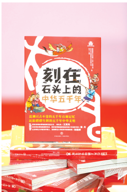
《刻在石头上的中华五千年》

《刻在石头上的中华五千年》以“国宝石刻文物”为脉络,强化文物与历史的对应关系,可以让少年儿童更有针对性地了解文物;全套书从少年儿童的兴趣出发,以孩子们的视角跟着石刻文物了解从石器时代到宋元明清的中国历史,将其中蕴含的中国文化起源、发展和传承,乃至文字的诞生、演变以及书法艺术一一道来,