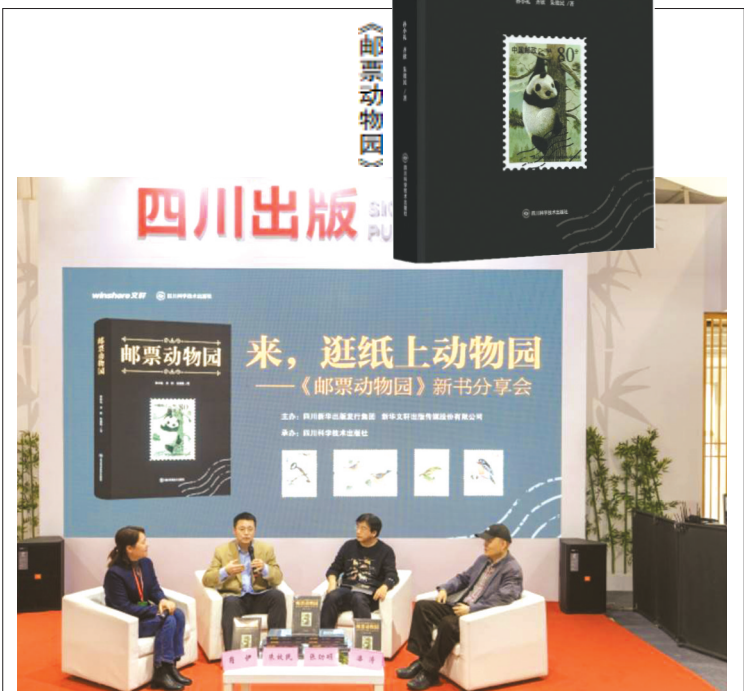
《邮票动物园》新书分享会