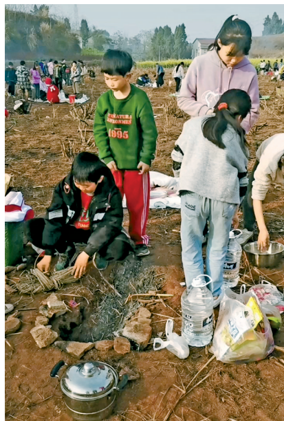
学生分组合作做饭。