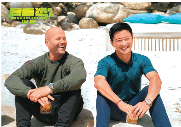
杰森·斯坦森与吴京

愿清单上。杰森·斯坦森曾在采访中透露，在《速度与激情：特别行动》时便有意与吴京合作，不过因为种种原因未能成功。此次终得合作，在网友直呼“活久见”之余，也引发了颇多期待。当英伦铁汉携手中国硬汉，强强联合，他们会在广阔的大海上掀起怎样的狂澜？强悍如他们，在对上比第一部更凶残的巨兽时，又能否“鲨口逃生”？