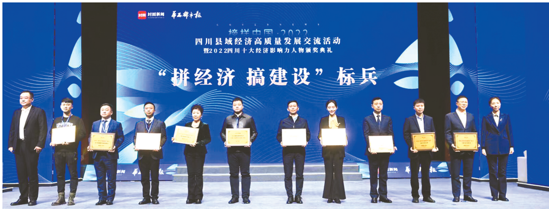
“2022四川‘拼经济搞建设’标兵”颁奖现场。

聚焦过去一年“拼经济搞建设”的典型榜样,挖掘推动四川经济稳定向好的新兴力量,从这场盛会,寻找高质量发展的答案。