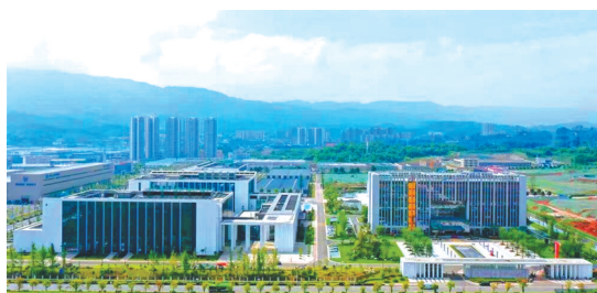
中国·雅安大数据产业园。

疫保供一线,坚持所有门店不关门、不断货、不涨价,并提供延时服务,充分保障市场供应稳定。