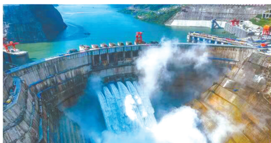
白鹤滩水电站。