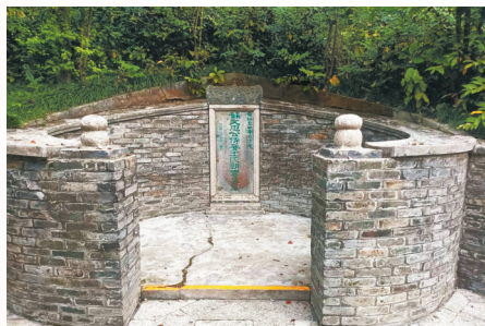
王朝云墓历代都有修葺。

早春二月的广东惠州，在阴云之下显出几分朦胧的美感。此时，来到位于城市中心的西湖景区，就能看到古色古香的亭台楼阁隐现于树木葱茏之中。走过苏公堤，再跨过横于平湖与丰湖之间的西新桥，从西湖孤山的东麓拾级而上，就能一路抵达王朝云墓。