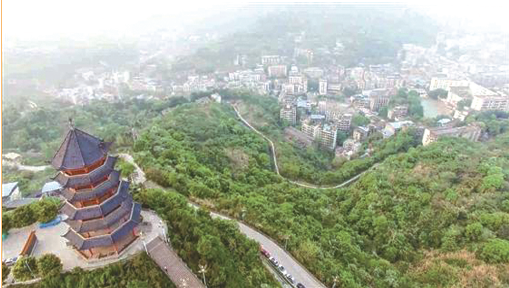
今日仁寿 图据仁寿县人民政府官网

因利所以聚人，因人所以成邑。从东汉时期凿井开始，由烧盐灶户聚居，后渐渐在仁寿三隅山下(今仁寿县文林街道)形成了热闹的街市，为方便管理行政和盐政，于此设置了郡、州、县，千百年来，无论朝代如何更迭，郡治和县治均设于三隅山下，足以见得凿井煮盐等工商业活动对于城市发展的重要性。所以同川南富顺县一样，仁寿亦是因盐而生，因盐而兴，是一座名副其实的“盐城”。