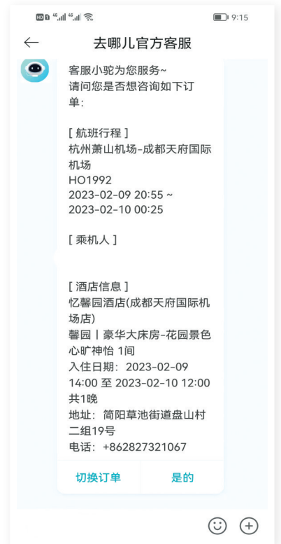
消费者的订单信息。

对此,四川明炬律师事务所律师夏畦表示,依据相关法律法规,消费者有权向平台要求“退一赔三”,共计1412元。