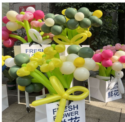
周女士制作的气球花束。