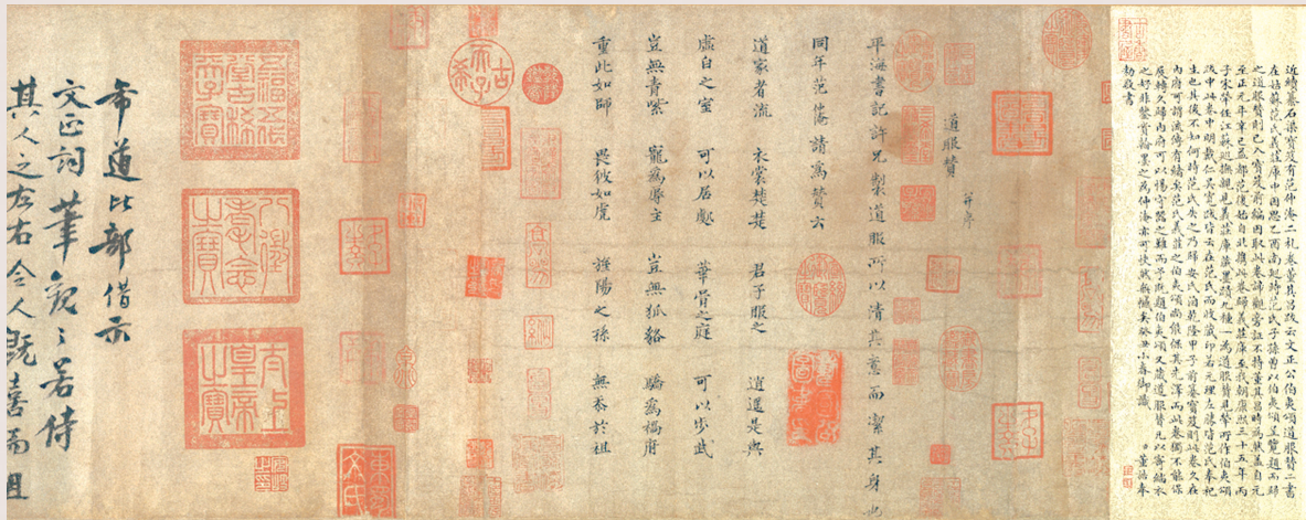
《道服赞》卷(局部) 宋 范仲淹