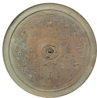
「五子登科」人物多宝纹铜镜

位于展厅中央的《杜牧行书张好好诗卷》格外引人注目。这是唐代诗人、书法家杜牧的仅存墨迹，也是罕见的唐代名人书法作品之一，原为清官旧藏，后流散民间，为张伯驹收藏。1956年张伯驹将其捐