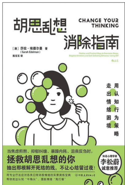
《胡思乱想消除指南》

生活服务广告 028-86969860 86969954 独家代理：四川欣闻报刊发行有限责任公司 收费标准：70元/行/天，每行13个字 代办点 寻找全省业务代理