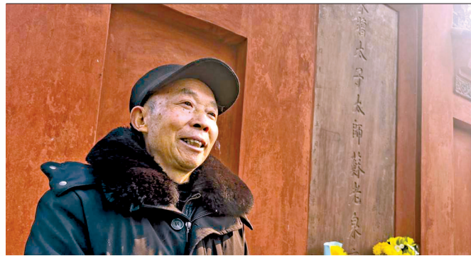
▲每一块碑，每一处景，每一个字，陶宗勤都能如数家珍。