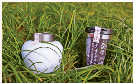
三苏祠博物馆为东坡先生准备的家乡水土。

老宅山坡上取土封装，并准备了家乡美食。届时，华西都市报、封面新闻记者将带着这些东坡先生想念了千年的故乡水土、家乡味道，前往河南郟县东坡墓祭拜，以慰东坡乡愁。