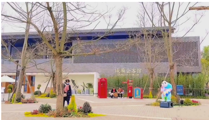
已经呈现在大众视线里的城厢会客馆。