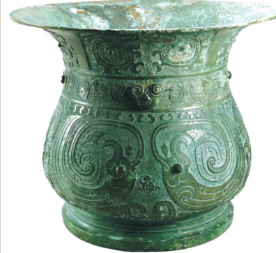
“大江万古流——长江下游文明特展”展出的青铜凤纹尊。镇江博物馆藏