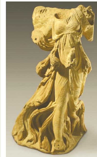
“古希腊人:运动员、战士和英雄——大英博物馆藏古希腊文物特展”展出的尼姬雕像。

新疆博物馆、新疆文物考古研究所、中国丝绸博物馆、甘肃简牍博物馆、旅顺博物馆、中国人民大学博物馆等多家收