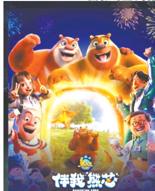
《熊出没·伴我“熊芯”》海报