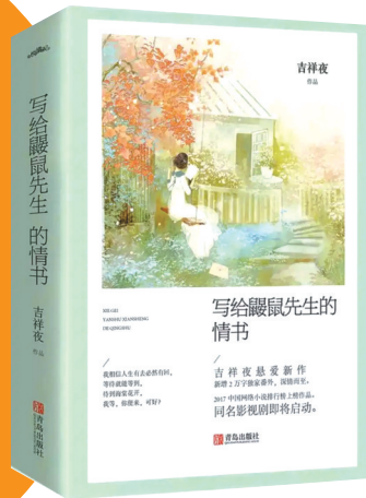
《写给鼯鼠先生的情书》