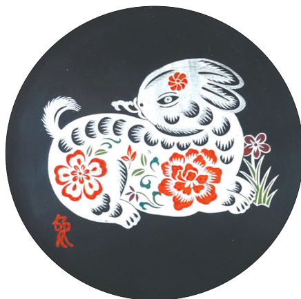
雕花填彩十二生肖圆盘——兔。

银花丝制作技艺已有两千多年的历史，于2008年被列入第二批国家级非物质文化遗产名录。成都银花丝制作技艺以白银为材料，以花丝平填著称，综合运用花丝和篆刻、填丝、垒丝、穿丝、搓丝、焊接等技艺。银花丝产品主要有瓶、盘、薰、鼎、盒等传统摆件以及钗、环、镯等饰品。在国家级传承人道安的手里，又新开发出了“银丝画”，让更多人了解了银花丝制作技艺。