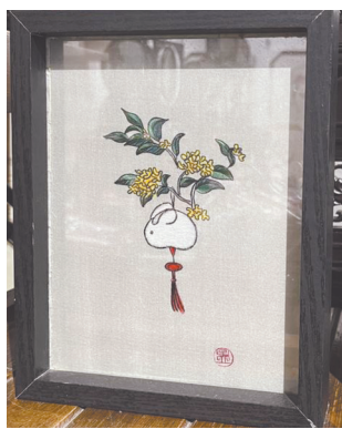
前途(钱兔)似锦。

生活服务广告 编资源 028-86969860 86969954 独家代理：四川欣闻报刊发行有限责任公司 收费标准：70元/行/天，每行13个字 代办点 锦江区 84545086 金牛区 83171377 红星路 86925677 眉山市 38111121 邛崃 88748235 简阳市 18030870828 阆中 15681062088 雅安传承 15281268866 寻找全省业务代理