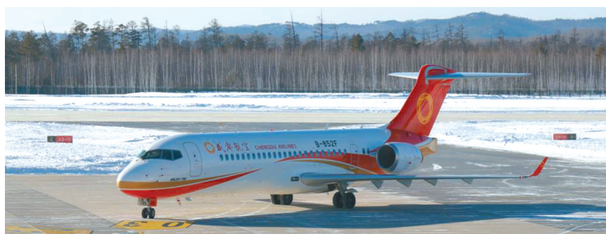
飞机停在漠河古莲机场。

据了解,漠河机场改扩建项目总投资8.05亿元,改扩建后,跑道延长至2800米,共开通哈尔滨至漠河、哈尔滨经停加格达奇至漠河两条航线。今年还将力争开通漠河至北京、长三角、珠三角的航线。