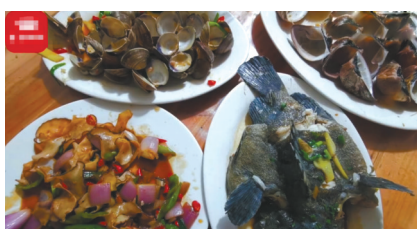
游客点的4个海鲜菜品。

在高德地图、大众点评、知乎等平台,不少用户在2021年就评价该店菜价昂贵,“三个人吃了八百多”,也有游客反映,自己是被出租车司机拉过去的。甚至有网友评论称,“司机带客有提成,四个菜加起来成本不到100块。”